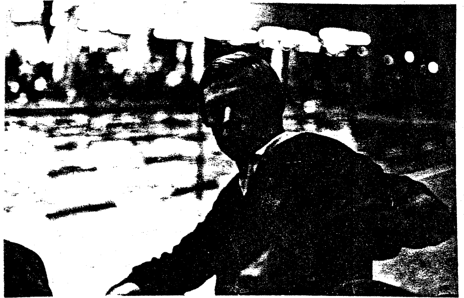
THE UP SIDE DOWN.....